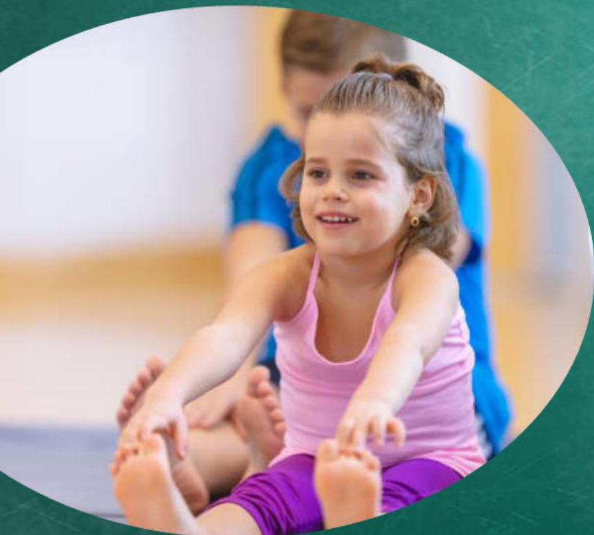
FIGURE DEL PROGETTO