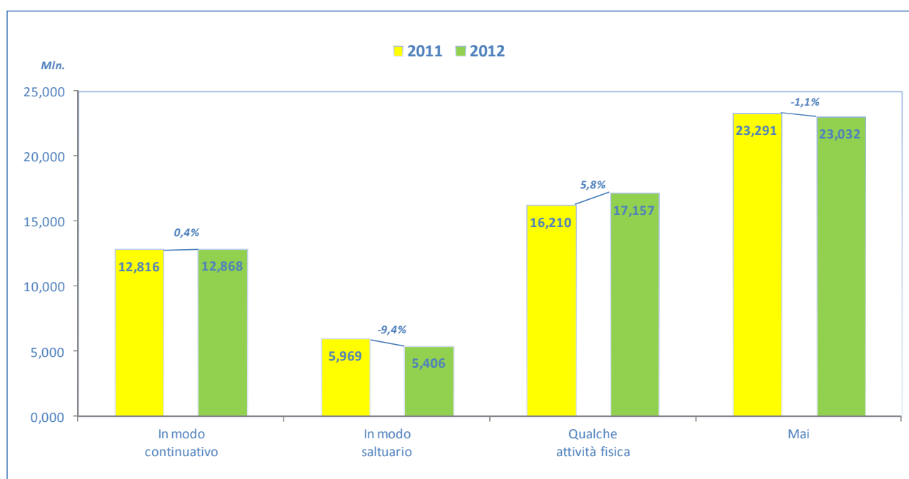
Grafico 5 - La pratica sportiva in Italia (valori assoluti e variazioni percentuali tra il 2011 e il 2012).

Note: il grafico non comprende i valori "non indicato" (circa 0,29 milioni di italiani).